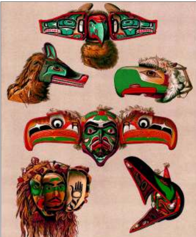
Masken der Kwakiutl: Die Indianer der Nordwestküste entwickelten eine große Kunstfertigkeit in der Holzbearbeitung. Davon zeugen ihre hölzernen Masken für kultische Zwecke.

Schon 1885/86, als er Masken und andere Artefakte für das Ethnologische Museum in Berlin zu erfassen und zu katalogisieren hatte, stellte Boas bei ersten Kontakten mit einer Gruppe von Bella Coola-Indianern in Berlin den Reichtum von deren Gedankenwelt fest. Entgegen der vorherrschenden Meinung handelte es sich nicht um Wilde auf der unteren Entwicklungsstufe der Jäger und Sammler, obwohl alle Völker der Nordwestküste seit Jahrtausenden vom Sammeln von Früchten, der Jagd und dem Fischfang lebten. In der Bearbeitung von Holz, für die sie viel Zeit verwendeten,