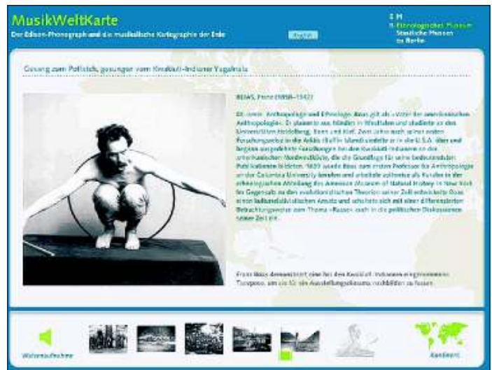
Musikweltkarte: Noch immer steht Boas (hier in einer Pose für den sogenannten „Hamatsa“-Tanz) für die Erforschung der Kulturen der Nordwestküste.

Die Musikweltkarte enthält neben Tonbeispielen aus allen Kontinenten auch Filmausschnitte und Texte zu Hintergründen und Forschern.